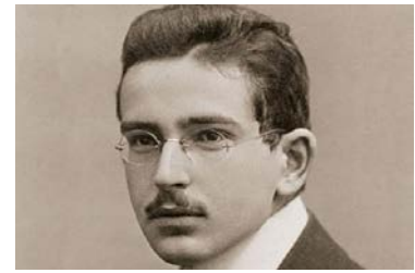
Walter Benjamin ca. 1913