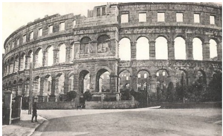
Amphitheater in Pola (Ansicht vom Hafen aus)

Um 6.30 Abfahrt von Spalato mit dem Eildampfer „Graf Wurmbrand“ des Oesterreichischen Lloyd. Der Dampfer war im Herbst 1898 in Dienst gestellt worden und das größte, schnellste und modernste Passagierschiff in der Adria. Die Reisegeschwindigkeit betrug 18 Knoten, fast doppelt so schnell wie die Eildampfer der Konkurrenz. Das Schiff bot Platz für 96 Passagiere erster Klasse, 30 Passagiere zweiter Klasse und 100 Passagiere dritter Klasse. Letztere kamen auf einem wettergeschützten Teil des Achterdecks unter. Auf der Fahrt nach Triest wurden zwei Häfen angelaufen: Zara und Pola. Da Freud und Martha auf der Hinfahrt in Zara übernachtet hatten, werden sie auf dem Schiff geblieben sein. In Pola allerdings lag das sehr gut erhaltene Amphitheater aus dem 1. Jahrhundert nur knapp 200m vom Anlegeplatz des Lloyd dampfers entfernt. Freud wird es sich nicht hat nehmen lassen, den Bau aus der Nähe in Augenschein zu nehmen. Um 22.00 lief die „Graf Wurmbrand“ in den Triestiner Hafen ein.