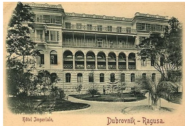
Das Grand Hotel Imperial in Ragusa