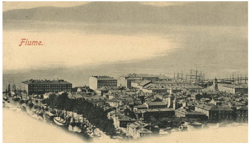
Blick von Tersatto auf Fiume

So wissen wir also sehr wenig von der weitesten Reise, die Freud je mit seiner Frau unternommen hat. Und es gab auch wenig Hoffnung, dass sich das ändern würde. Doch dann fiel mir auf einer Postkarte Freuds an Martha vom 29. August 1904 eine Bemerkung auf, die ich 25 Jahre lang überlesen hatte: Freud und sein Bruder Alexander hatten vor der Abreise von Triest nach Athen etwas Zeit und fuhren mit der Zahnradbahn von Triest nach Opicina, einem kleinen Städtchen oberhalb von Triest „mit entzückendster Aussicht auf die Stadt wie Tersatto 4 bei Fiume“. 5 Diese Beschreibung Freuds macht nur Sinn, wenn der Adressat der Postkarte weiß worauf sich die Bemerkung bezieht – nämlich auf eine Anhöhe mit Festung und Wallfahrtskirche oberhalb von Fiume (heute Rijeka), von der aus man die gesamte Bucht von Fiume überblicken kann. Freud musste also mit seiner Frau in Fiume gewesen sein. Die einzige Gelegenheit, die dafür in Frage kommt war die Dalmatienreise von 1898.