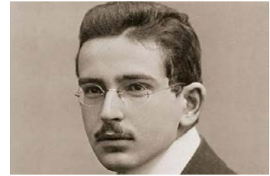
Walter Benjamin ca. 1913