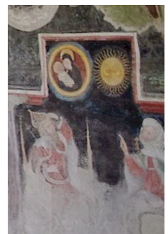
Kaiser Augustus und die Sibylle von Tibur im Kreuzgang des Doms in Brixen Fresko von Andreas de Bembis de Freud