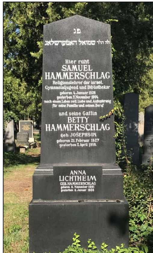
Das Grab von Samuel Hammerschlag (September 2019)

Es vergingen noch neun Jahre bis zu Freuds eigenem Tod. Hätte er ein Jahr vor seinem Tod nicht nach England emigrieren müssen und seine letzte Ruhestätte auf dem Gelände des Krematoriums in Golders Green im Norden Londons gefunden, wäre er auf dem Wiener Zentralfriedhof beigesetzt worden.