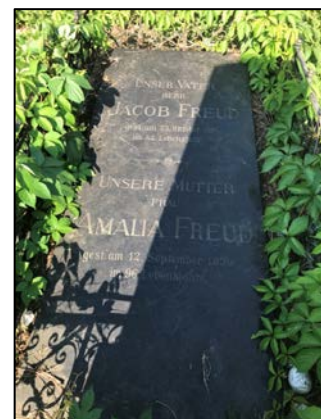
Das Grab von Freuds Eltern heute (September 2009)